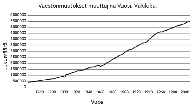
Kuvio 3. Suomen väestönkasvu 19

resursseja ja mikäli näitä ei ole saatavilla, oletetusti järjestelmä sakkaa 20 . Lyhyen aikavälin haitat tietenkin koituvat ihmisille, mutta jokainen hidastus ja katkos teollisuudessa antavat biosfäärille aikaa toipua 21 . Syytä riemuun ei tosin vielä ole, sillä Suomen kansantalouden osuus maailman taloudesta on hyvin pieni, vaikkakin kulutuksessa per henkilö Suomi on maailman kärjessä. Toinen syy rajoittaa innostusta löytyy siitä, että väestön määrä Suomessa jatkaa kasvuaan ja syntyvyyden aiheuttama lasku tuskin näkyy suomalaisten lukumäärässä vielä pitkään aikaan (kuvio 3). Tähän suurimmat syyt ovat ilmastonmuutoksen aiheuttama muuttoliike ja globaali väestönkehitys, joka tarkoittaa nyt yli 130 miljoonan ihmisen lisääntymistä vuosittain 22 . YK:n 16 ennusteen mukaan olemme globaalisti lähellä 10 miljardia ihmistä kolmen vuosikymmenen kuluttua ja vuonna 2100 ihmisiä on jo yli 11 miljardia.