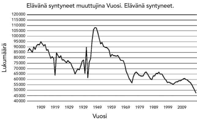
Kuvio 2. Syntyneet Suomessa 19

Suomalaisessa talouspoliittisessa keskustelussa ollaan toki huolissaan ihmisten määrästä, mutta syystä, joka on ennemmin taloudellinen (tähtää taloudellisen vaurauden ylläpitämiseen ja kasvuun) kuin ekologinen. Jos yhteiskunnassa ei nimittäin ole tekijöitä – sekä työsuoritteiden tekijöitä että niiden kuluttajia – heikkenevät talouden kasvunäkymät. Ja jos talouden koko ei kasva, on globaaleihin markkinoihin kiinnittyvän kasvuperustaisen yhteiskunnan vaikeaa, ellei mahdotonta, nostaa tai edes ylläpitää sen hetkistä elintasoja. Syntyvyyden laskuun Suomessa liittyy keskeisesti myös huoli väestörakenteen muutoksesta ja siihen kytkeytyvästä eläkejärjestelmän maksukyvyttömyydestä. Kansantaloudelliset näkymät ovat oikeastaan melko katastrofaaliset Suomessa, mikäli syntyvyys jatkaa laskevaa kehitystään (kuvio 2). Mitä käykään nyt vielä vaurastuvalle Suomelle, jos se ei pysy kansainvälisessä talouskilpailussa mukana?